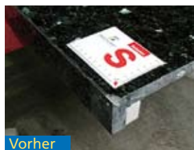
Riss in Waschtischplatte (Belgisch Granit Kalkstein)